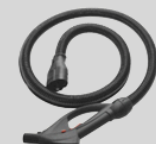
Impugnatura con tubo flessibile