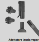
Adattatore lancia vapore